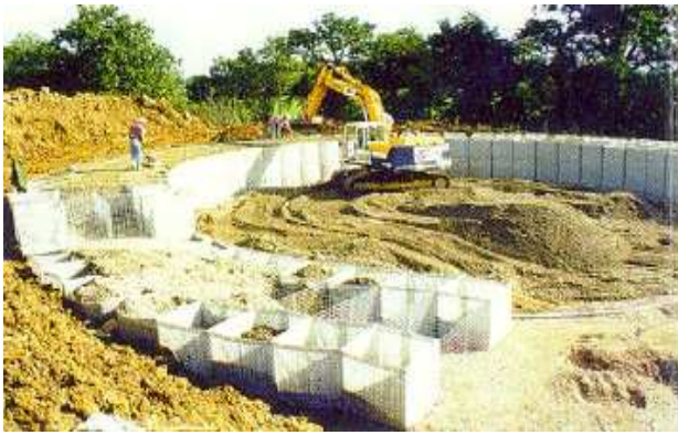
Fig.2 - Remplissage des éléments